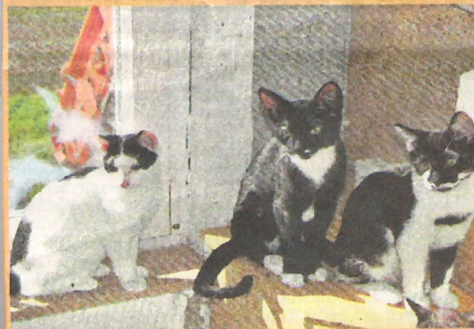
Die Katzen-Kinderstube in der Pflegestelle in Brunkensen. Wer gibt den Samtpfoten ein neues Zuhause?

Dann melden Sie sich bitte bei Frau Trabing unter Tel. (0 51 81) 57 25 (ab 16 Uhr). Sie können den Tierschutzverein Alfeld e.V. natürlich auch gerne mit einer Spende unterstützen.